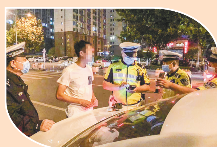
▲国庆期间,潍坊市公安局交警支队先后开展第十五次、第十六次严查酒驾醉驾集中统一行动。潍坊日报社全媒体记者 常方方 摄

国庆假期,我市各行各业众多劳动者依然坚守一线,奋战在各自岗位,在辛勤工作中度过假期,以坚守诠释担当,用奉献书写责任,以实际行动迎接党的二十大胜利召开。