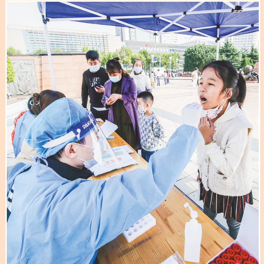
▲10月6日,在世界风筝都纪念广场,学生们正在进行核酸检测采样。为保障学生对核酸检测的需求,当日,奎文区东关街道在世界风筝都纪念广场设立核酸检测学生专场,切实为校园安全筑起一道坚实的“防护墙”。