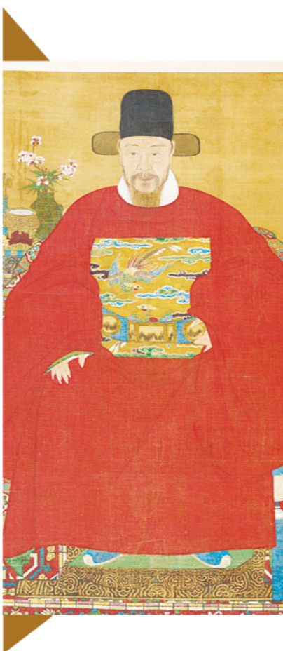
明状元赵秉忠画像(资料图片)。