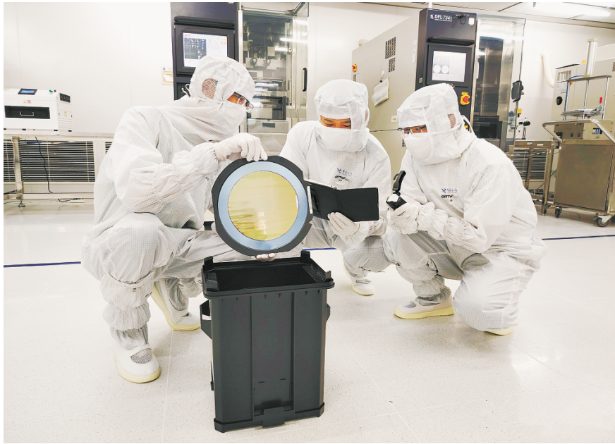
潍坊海关通过“口岸外查验+目的地综合处置”模式助力企业货物通关(资料图片)。

编者按 港通四海启新航,海纳百川聚动能。海洋经济是支撑潍坊奋进万亿城市的关键所在,而港口作为发展海洋经济的“战略棋眼”,其作用无可替代。当前,潍坊港5万吨级航道等重点基础设施加快建设,对我市深度融入“一带一路”建设、构建陆海联动开放新格局、加快建设现代化国际枢纽港口具有里程碑意义。即日起,本报联合市交通运输局、市综合交通事业发展中心、潍坊交通发展集团有限公司,开设“擦亮潍坊港城市名片 我们在行动”专栏,聚焦市直部门与上属驻潍单位服务港口建设发展的主要经验做法,以鲜活实践彰显各方助力港口提质升级的担当,为潍坊港冲刺亿吨港注入强劲合力。敬请关注。