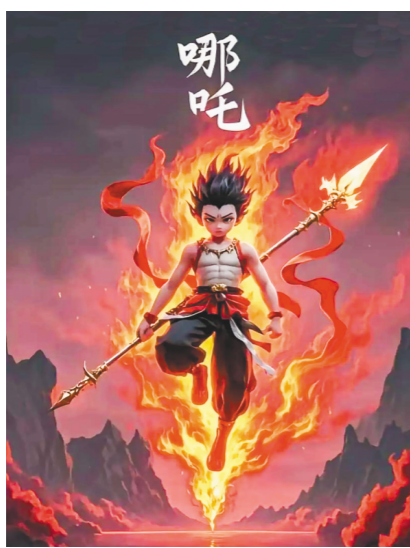
△哪吒在现代影片中的造型。

哪吒的故事有《封神演义》《西游记》和现代电影三个版本。故事中，李靖手中的宝塔从镇压之器变为无形之爱，哪吒的反抗从剔骨还父转向对抗天命，这背后映照的是一部中国人民精神世界的变迁史。