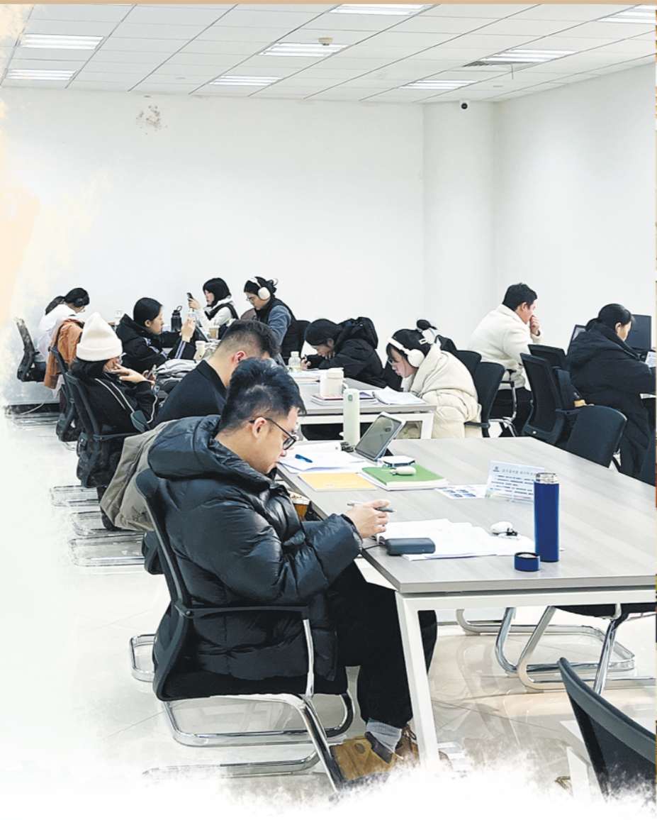
市图书馆内,市民们在阅读。

“不比金银比学问”,前不久,青州出了个“博士村”的消息引起热议。西张村也因“博士村”的称号吸引不少游客前往当地“打卡”,人们在这里感受到浓浓的书香氛围。 全民阅读浸润城市文化底蕴。通过近日潍坊市图书馆发布的2025年阅读数据不难发现,阅读已是潍坊人生活的重要组成部分。文化持续沁润城乡,城市的文明形象也随之得到提升。“腹有诗书气自华,最是书香能致远。”通过阅读,我们看到的,是一个更有底蕴、有活力、有希望的潍坊。