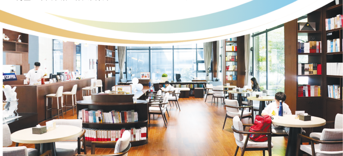
城区一处城市书房(资料图片)。