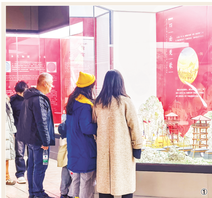
图①:游客在潍坊风筝博物馆参观,图②:高密红高粱抗战馆,图③:青州博物馆展出的明代状元赵秉忠殿试卷。

去年以来,潍坊博物馆系统持续丰富展览供给,打造精品展陈,多项成果获奖。全市博物馆深挖民间文化,佛教造像等本土特色文脉,打造的原创新展策展精良、亮点纷呈,广受观众好评。全市博物馆持续优化社会教育服务,核心服务指标大幅提升。各馆深挖本土金石、古生物、非遗等文化资源,开展研学课堂、文博讲座、非遗体验等多元化社教活动,服务覆盖全年龄