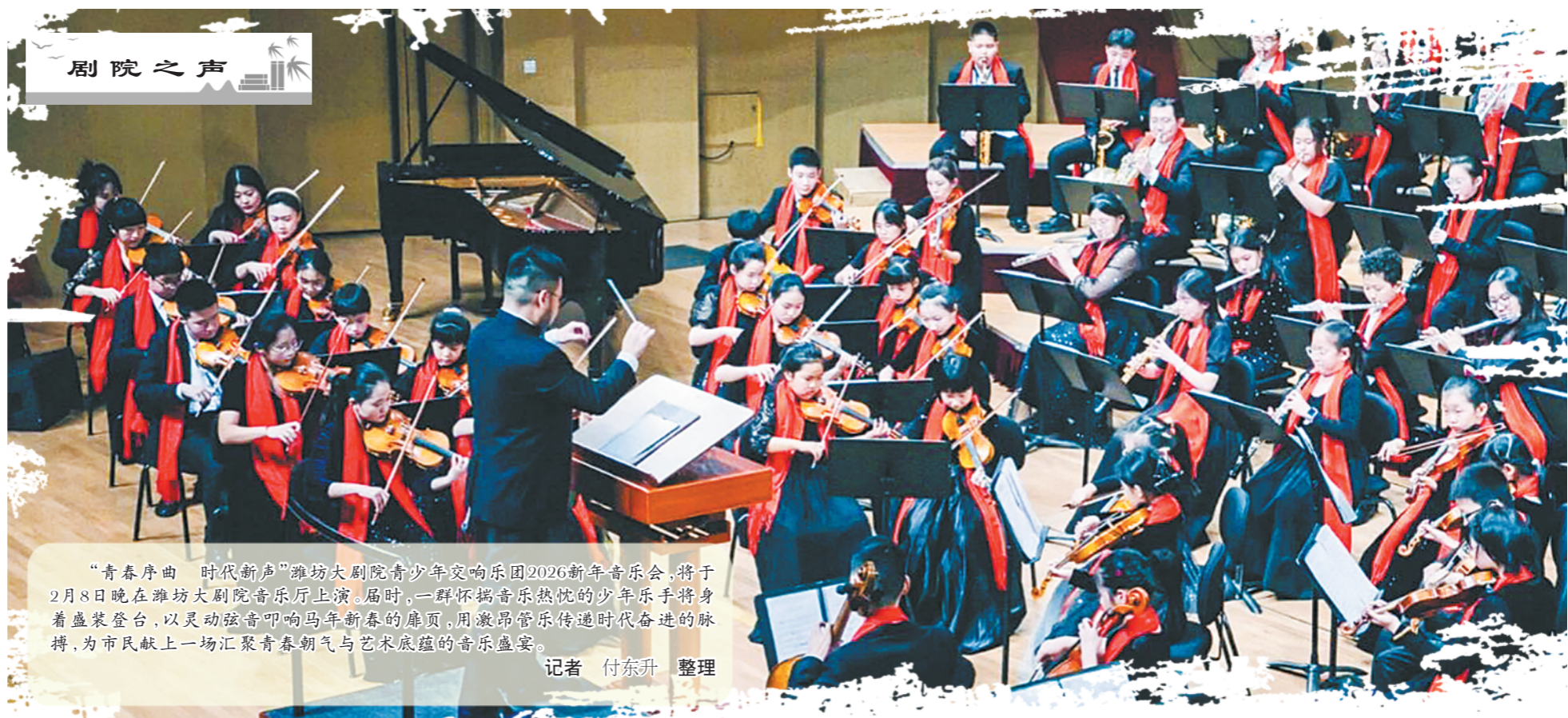
“青春序曲 时代新声”潍坊大剧院青少年交响乐团2026新年音乐会，将于2月8日晚在潍坊大剧院音乐厅上演。届时，一群怀揣音乐热情的少年乐手将身着盛装登台，以灵动弦音叩响马年新春的扉页，用激昂管乐传递时代奋进的脉搏，为市民献上一场汇聚青春朝气与艺术底蕴的音乐盛宴。

如果历史有锁孔，好奇心就是那把“金钥匙”。我觉得马伯庸就是那个掌握了“金钥匙”的人。他用丰沛的阅读和旺盛的好奇心，为写作打开了一扇新天地。他将在史海中捡拾起的一只只小小贝壳串联成珠，为读者捧出了这本好玩又好读的《历史中的大与小》。