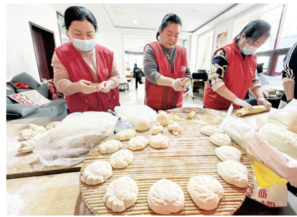
△2月12日,在奎文区东关街道奎文门社区,居民和志愿者们正在制作面食。

面对消费者对“好彩头”的强劲需求,商家们在选品与营销上铆足了劲。2月8日,位于城区新华路与胜利东街交叉口的服装店工作人员说,今年的春节红装呈现出两个特点,日常化设计增多,“好穿不闲置”成为消费者选购的重要考量;年轻男性消费者购买意愿明显提升,以前很多男士觉得红色太扎眼,今年主动来问红色系卫衣、红色围巾的男顾客多了不少。