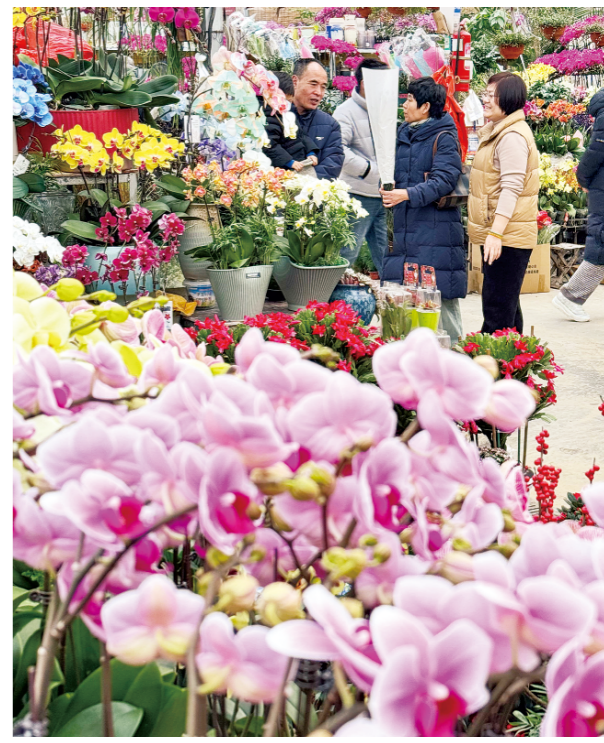
△2月9日,市民购买鲜花装点家居。