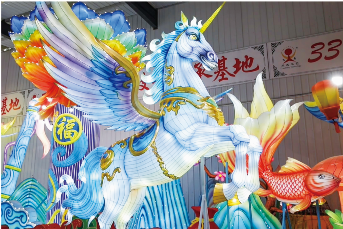
△寒亭非遗花灯。

百年非遗的生命力,在于传承,更在于创新。如今的杨家埠花灯,在坚守匠心的同时,不断融入现代元素:骨架摒弃传统材质,改用钢丝、钢条焊接而成,更显稳固耐用;工艺上融入现代机械传动与LED光源技术,点亮后光影交错、灵动鲜活,将传统非遗韵味与现代科技美感完美融合。记者注意到,彩绘工匠们手握画笔、落笔生花,一笔一画将瑞兽祥瑞、新春愿景勾勒于灯身之上,光影流转间,一盏盏花灯渐具雏形,既承载着老匠人的匠心巧思,也氤氲着浓浓的非遗韵味与新年喜气。