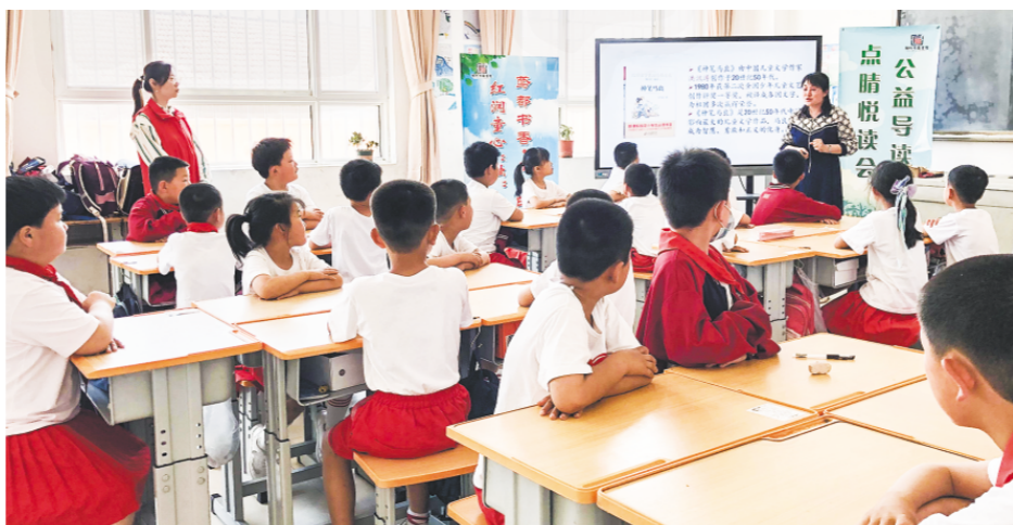
△志愿者在我市乡村小学,开展“点晴悦读会”公益导读活动。(本栏图片均为资料图片)