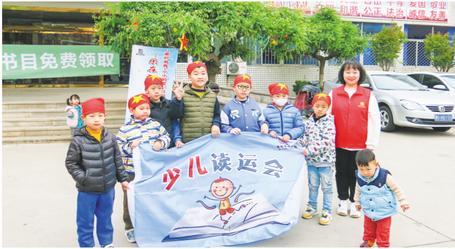
△志愿者走进社区开展“乐在动中读”读运会活动。

在潍坊市图书馆举办的“绘本里的中国”活动现场,近三十组亲子家庭沉浸其中,接受中华民族优秀传统文化的熏陶。 “孩子们,你们知道重阳节为什么要登高吗?”志愿者翻开绘本,将古老的传说娓娓道来。桓景登山避灾的故事在她温柔的声音里活了起来,孩子们的眼睛亮晶晶的,仿佛穿越时空,看见了那个勇敢的少年。讲到佩茱萸、饮菊花酒、吃重阳糕的习俗时,小伙伴们争先恐后地举手:“我吃过重阳糕!”“奶奶家有茱萸!”稚嫩的童声里,传统文化的种子开始生根发芽。 “妈妈,这个要怎么卷呀?”在令人期待的动手环节中,一个小女孩举着纸条,有些发愁。旁边的妈妈握住她的小手,一起轻轻地